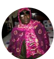
FAMA KA Handifem

"Je salue l'initiative de la SONATEL. Ils ne cessent de nous aider depuis l'exposition où ils ont acheté tous nos produits jusqu'ici. Ils nous ont même offerts des paniers de "Ndogou" pendant le mois de Ramadan."