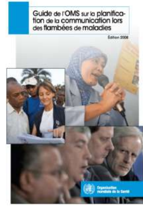
GUIDE OMS PLANIFICATION DE LA COM LORS DES FLAMBÉS DE MALADIES