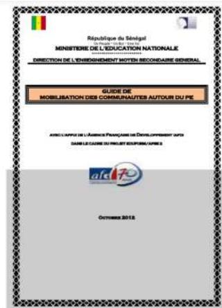
GUIDE DE MOBILISATION COMMUNAUTAIRE PE