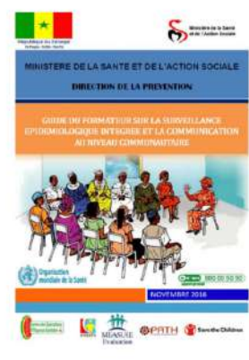
GUIDE DU FORMATEUR VERSION FINALE DU 17_11_16